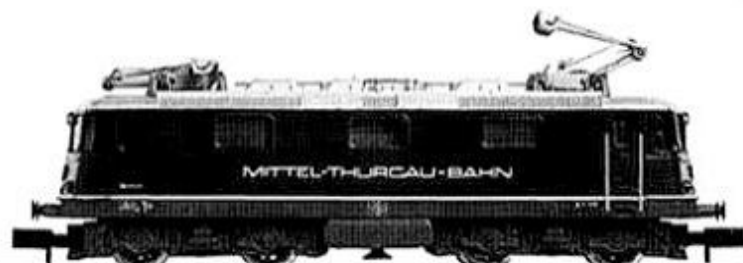
Re4/4 21 MThB