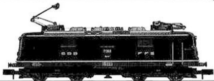
Re4/4 11369 SBB